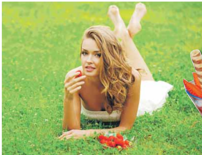
Kaum einer kann ihnen widerstehen, den aromatischen frechen Früchtchen, die man Erdbeeren nennt.

Sicher geht es Ihnen auch so. Wenn die ersten Erdbeeren in den Regalen des Supermarkts liegen, sind wir geneigt zuzugreifen und sie mit nach Hause zu nehmen. Wohlweisend, dass wir bestimmt eine Enttäuschung erleben, weil das Aroma nicht hält, was das Aussehen verspricht. Kein Wunder, sagen wir dann meist, es ist ja auch noch keine Erdbeerzeit. Und nun, wo die kleinen roten Früchtchen im heimischen Garten heranreifen, die Erdbeerbüschel der Landwirte in ein Meer aus rot getupftem Grün verwandeln und der Obstabteilung des Lebensmittelmarkts nicht nur Farbe verleihen, sondern sie auch verführerisch beduften, wissen wir, jetzt ist es Zeit für beerige Sünden. Auf dem Kuchen, im Quark oder