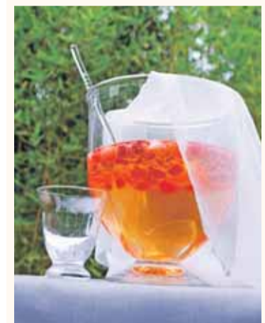
Erhältlich bei Galeria Kaufhof (Abb. ähnlich)

Ganz sicher besitzt Ihre Mutter eins, und auch Ihre Großmutter hatte bestimmt ein Set im Schrank, gemeint ist die Bowle. Gerade zur Erdbeerzeit ein unverzichtbares Accessoire. Übrigens, nicht nur mit Alkohol ist eine Bowle purer Genuss, es geht auch ohne. Dann ist sie nicht nur süffig, sondern auch noch herrlich erfrischend.