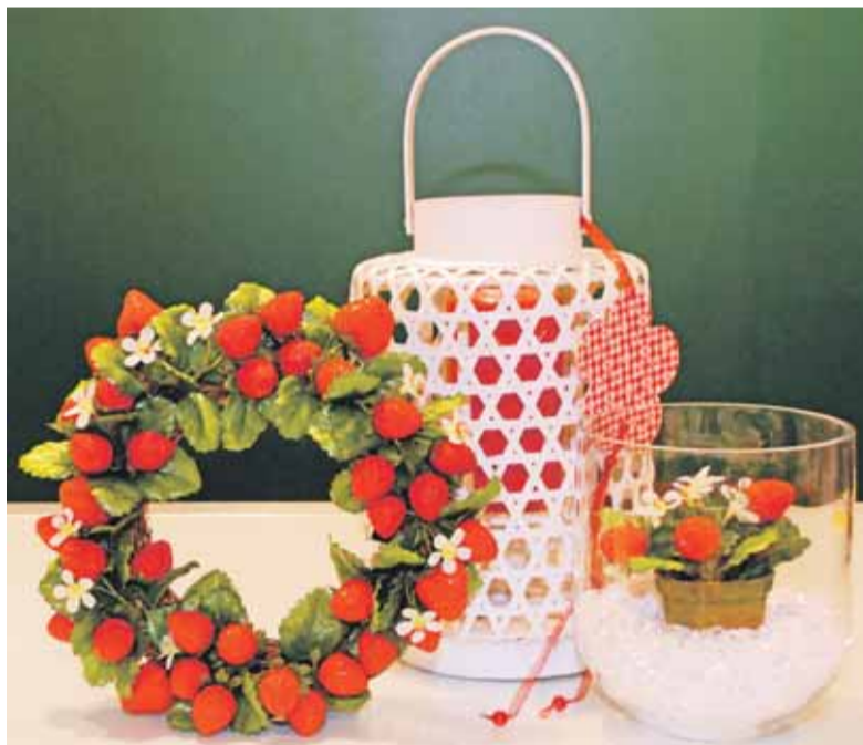
Zum Anbeißen hübsch sind diese beerigen Dekorationsartikel.

Diese Accessoires sorgen für Sommerfrische