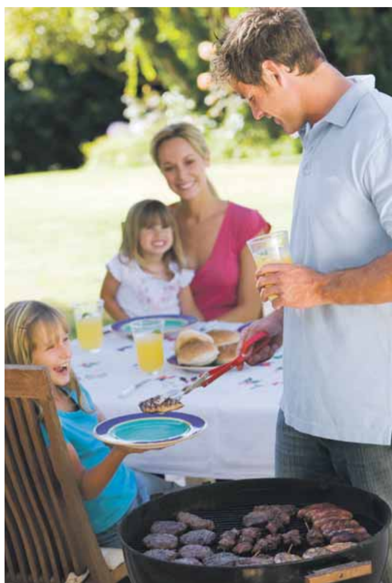
Herrlich, so ein Grillnachmittag im Freien. Purer Genuss – nicht nur für den Gaumen, sondern auch für die Sinne.

Beispiel kann auf den Punkt gegart werden, ohne trocken und zäh zu werden. Vorbei sind auch die Zeiten, in denen die Gemüsespieße außen verbrannt und innen noch Rohkost waren. Kartoffeln gelingen nahezu immer perfekt – auch denen, die nicht zu den absoluten Grillprofis gehören und Tofuwürstchen glücken sozusagen im Wurstumdrehen. Aber natürlich ist so ein Grill nicht für jeden erschwinglich und für manchen ist der Erwerb einer solchen Hightech-Outdoorküche schier unrentabel, weil sie zu wenig genutzt werden könnte. Wer also beim einfachen, guten alten Grill bleiben will, muss nicht verzweifeln. Natürlich gelingt das Grillgut auch mit ihm, es braucht halt nur ein bisschen mehr Gefühl in der Grillzange. Zahlreiche gut geschriebene Bücher können ebenso dabei helfen, dass das Grillgut perfekt gelingt. Außerdem hält vielleicht der nette Nachbar, der bereits zum Grillkönig avanciert ist, ein paar Tipps für Sie bereit. Alles was Sie sonst noch brauchen, damit Ihr nächstes Grillvorhaben zum genussvollen Erlebnis wird, finden Sie im Hessen-Center. Schauen Sie also unbedingt bald wieder herein und genießen Sie die Grillsaison in vollen Zügen. Wir freuen uns auf Sie!