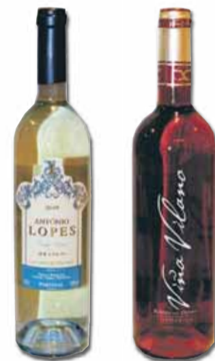
Gesehen bei Weindepot Vinum

▼ Diese beiden Weine sind die perfekte Ergänzung zum Grillen, der „grüne“ Portugiese mit geringem Alkoholgehalt passt perfekt zu Fisch. Während sich sein fruchtiger, roter spanischer Freund gern zu Fleischgerichten gesellt und ebenfalls kalt getrunken werden möchte. Kenner zählen den Rosé zu den besten der Welt. Probieren sollten Sie beide.