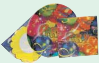
Girlanden, Servietten und Papp-teller – gesehen bei McPaper.

Haben Sie mal wieder Lust, Ihre Freunde zu einer fröhlichen Gartenparty einzuladen? Nur zu, der Sommer ruft förmlich danach, und der Garten freut sich auch, mal wieder hübsch dekoriert zu werden. Ihre Gäste werden schier begeistert sein an einem hübsch gedeckten Tisch Platz zu nehmen, die sich von Baum zu Baum schlängelnden Girlanden zu betrachten und sich an den Lampions und Windlichtern zu erfreuen, die Ihren Garten bei Einbrechen der Dunkelheit in ein stimmungsvolles Licht tauchen.