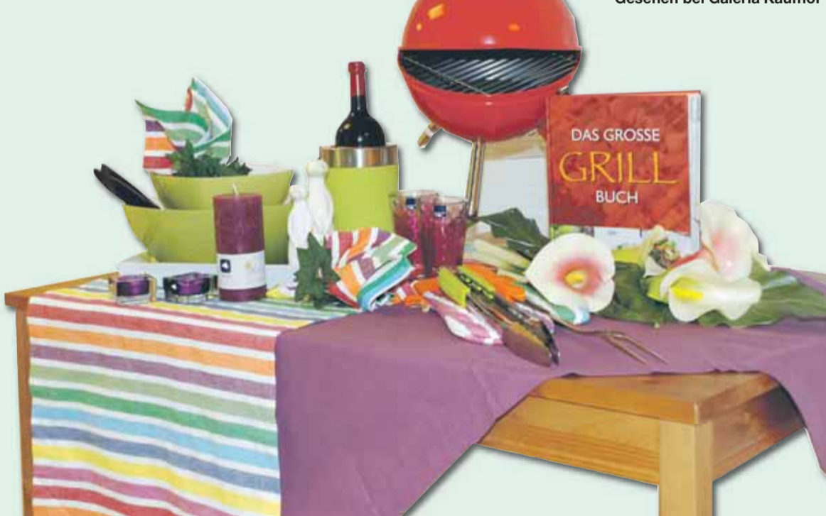
Gesehen bei Galeria Kaufhof

Man nehme: einen stylischen Kühler für gut temperierte Getränke, farbenfrohe Salatschüsseln, die schon ohne Inhalt von Sommerfrische künden, trendige Teelichthalter und Kerzen, Gläser in beerigen Tönen, einen fröhlich gestreiften Tischläufer, der harmonisch mit einer unifarbene Tischdecke korrespondiert, einen angesagten Kugelgrill, Grillzange, Grillgabel und Rezeptbuch, ein Blumenarrangement und lustige Erdmännchen, die aufpassen, dass alles in Ordnung ist – und schon kann die Grillparty steigen. Das heißt noch nicht ganz, denn natürlich sollte auch stilvolles Porzellan nicht fehlen.