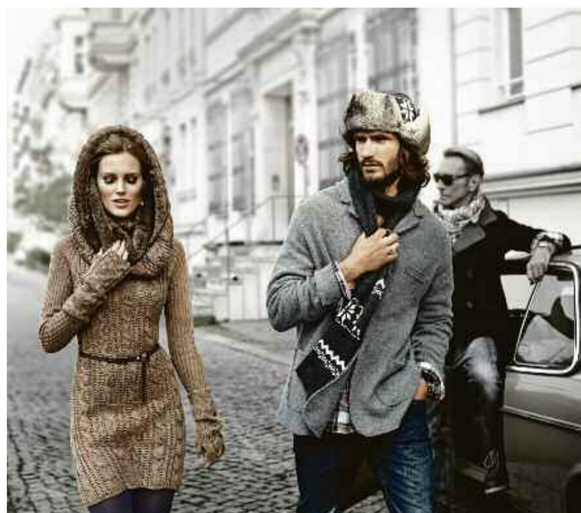
Entdecken Sie ab 20. September „Galeria 1879 by Wolfgang Joop“ in Ihrer Galeria Kaufhof.

tag modisch bereichern: „Ich habe mir überlegt, was ich von all den modischen Dingen, die ich mir in meinem Leben angeschafft habe, behalten möchte. Diese Kollektion ist – wenn man so will – eine Kombination aus meinen Lieblingsstücken.“ Dazu gehören beispielsweise Schals, Mützen, Jeans, Pullover, Hemden im Holzfäller-Stil, Leder- und Strickjacken, aber auch Boots sowie Taschen und Weekender. Sie bieten eine ideale Basisausstattung, die die eigene Garderobe vervollständigt – eine Besonderheit von „Galeria 1879 by Wolfgang Joop“. Alle Teile überzeugen mit perfekten Schnitten, einer guten Passform und qualitativ hochwertigen Materialien. Warme Herbst- und Naturtöne wie Marone, Noisette, Caramel, Beige und klassische Farben wie Grau und Cherise garantieren gute Kombinationsmöglichkeiten. Akzente setzen individuelle Details: Dazu gehören beispielsweise Metallic-Applikationen, Patches und sogar das Innenfutter von Hosen und Schuhen im Karo-Design. Die Kleidungsstücke sind für Damen in den Konfektionsgrößen 36 bis 44 und für Herren in 50 bis 56 erhältlich.