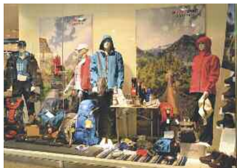
Eine riesige Auswahl an Produkten für Ihre Wanderausrüstung finden Sie bei Intersport Leister im Hessen-Center.