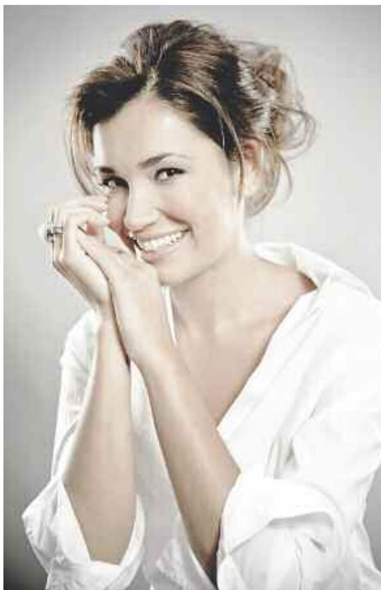
Prominente Unterstützung. Beim großen Finale zum Hessen-Center-Model 2011 wohnt Jana Ina Zarella der Jury bei.

Die Vorentscheidung ist abgeschlossen. Unter Hunderten Bewerberinnen und Bewerbern wurden 30 Nachwuchstalente für das große Modelcasting im Hessen-Center ausgewählt. Sie werden von Freitag, 2. September, bis zum verkaufsoffenen Sonntag, 4. September, lernen, was man bei einem Styling für ein Foto-Shooting beachten muss, und bekommen ein professionelles Lauf- und Choreografie-Training. Zum verkaufsoffenen Sonntag am 4. September werden die Kandidaten darüber hinaus als lebendige Schaufensterfiguren (Living Doll) in den Mietbereichen zu sehen sein. Ein wirkliches Highlight, das man sich nicht entgehen lassen sollte! Sie werden ihre Aufgabe sicher so perfekt meistern, dass es nicht leicht sein wird, sie von den Schaufensterfiguren zu unterscheiden – überzeugen Sie sich selbst. Auch am darauf folgenden Wochenende geht es auf den Laufsteg. Dann wird für die große Fashion-Show trainiert. Am Nachmittag wird schließlich die Entscheidung fallen – wer wird Hessen-Center-Model 2011?