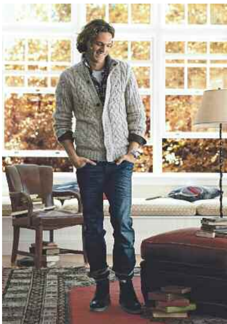
Casualwear wird angezogener – auch bei Tom Tailor. Schauen Sie bald mal wieder im Store herein, es gibt viel zu entdecken.

Casualwear wird wieder angezogener. Ein harmonischer Stilmix bestimmt das Bild. Unverkennbar ist der Einfluss der späten 50er- und frühen 60er-Jahre – der an die rebellische britische Arbeiterjugend erinnert. Die Kollektion ist eine gelungene Komposition aus schicker Urbanität und lässiger Coolness. So treffen beispielsweise grob gestrickte Pullover und Cardigans, gern auch mit Schal-kragen, auf Karohemden und lässige Jeans, Glencheck-Sakkos mit Lederellbogenpatches und strukturierte Hemden auf körnige Flannel-Woll-Chinos.