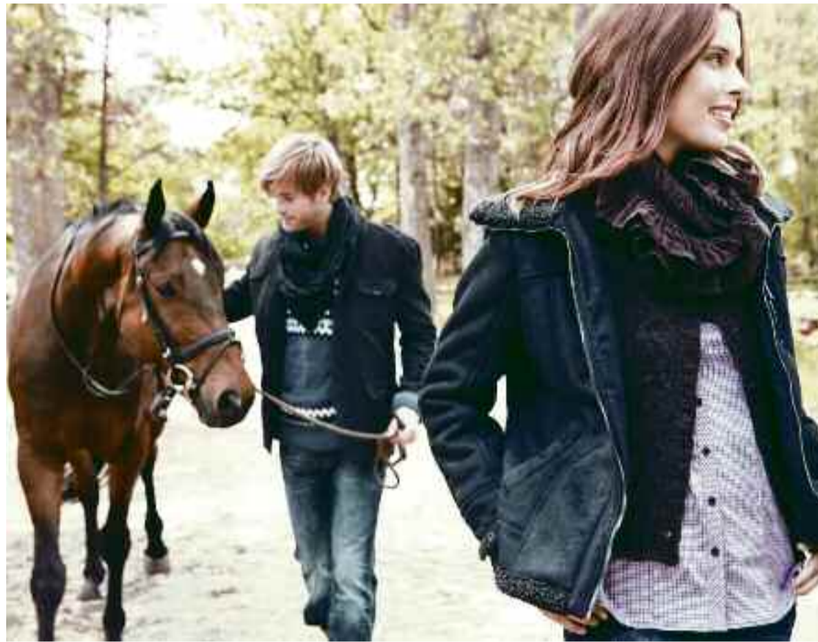
Country-Life wird in dieser Saison großgeschrieben. Der lässige, aber dennoch angezogene Look ist der Trend in der Damen- und Herrenmode.

Die neue Herbst- und Wintermode verpflichtet schon fast dazu, mal wieder einen Tag auf dem Land zu verbringen und die Natur zu erleben. Denn Rustikalität ist eines der modischen Topthemen in dieser Saison. Für die Damen heißt das, kernige Jacken aus Fleece, Leder oder gewachsenen, gewaschenen Qualitäten sind ein Muss. Cord, Fell und grob gestrickte Pullover, Cordblazer (gern mit Ellbogenpatches), Cordhosen (kurz oder lang) gehören ebenso zur neuen Herbst/Winter-Garderobe wie Tweed und Karos – der Brit-Chic lässt grüßen. Auffällig: SIE trägt auf Pullover und Jacke oder Blazer gern einen schmalen Gürtel. Auch bei IHM geht es kernig zu, wenn gleich nicht nur Naturburschen mit Karohemd oder griffigen Unihemden, Parker und Chino den Ton angeben, sondern auch smarte Kerle unterwegs sind, für die das Sakko oder der Blazer das Must-Have der Saison darstellen. Es kommt nicht selten mit Ärmelpatches, Unterkragen und farbigen Knopflöchern daher und weckt in IHM die Freude am Kombinieren.