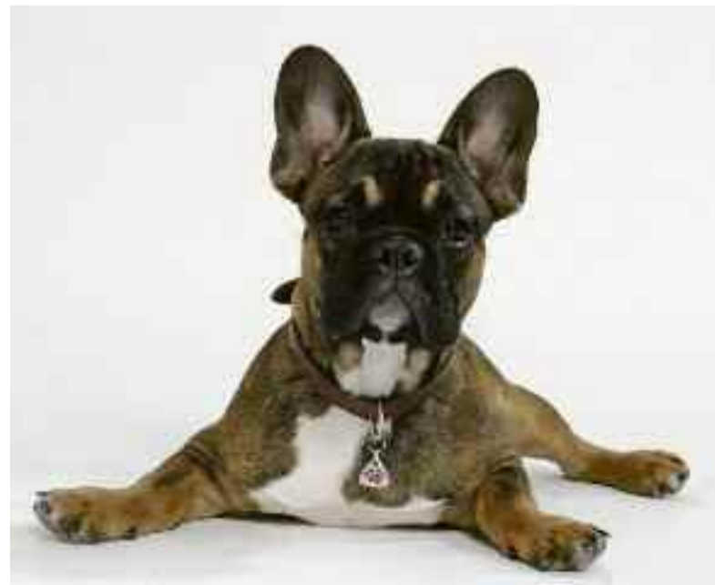
Ist Ihr bester Freund fotogen? Dann setzen Sie ihn in Szene.

sen-Center unter den ausgestellten Tier-Fotos den „Tier-Star 2011“ wählen. Wer sich an der Wahl beteiligt, kann ebenfalls gewinnen: Unter allen Mitspielern verlost Probild-Studio drei exklusive Fotoserien. Die Teilnahmekarten liegen vor Ort aus, sie sind einfach auszufüllen und in die Losbox einzuwerfen. Der „Tier-Star“ und seine Besitzer erhalten das Siegerfoto als hochwertige Fotoleinwand im beeindruckenden Format 60x80 cm, der Zweitplatzierte eine 50x70-cm- und der Drittplatzierte eine 40x60-cm-Leinwand.