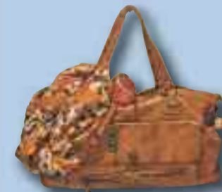
Gesehen bei pieces