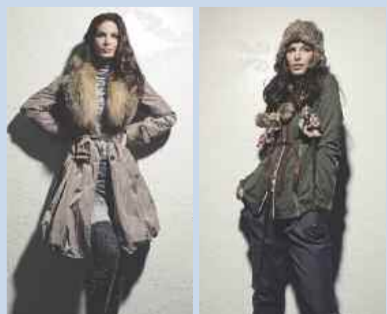
Edle Materialien wie Pelz und Fell sind auch bei Corny's Boutique eines der modischen Topthemen in der kommenden Saison. Fotos: Sportalm Herbst-Winter 2011/12, Kollektion: Emotion