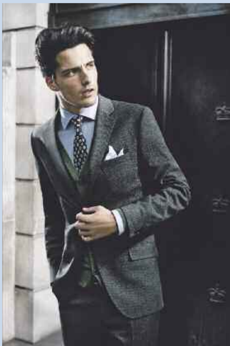
Ein unverzichtbarer Look für gut angezogene Männer: Schlankes Zweiknopfsakko mit schmalen Revers, dazu Weste, Hemd, Krawatte und Hose – fertig ist der Business-Look für smarte Typen, die auch beim Outfit nichts dem Zufall überlassen.