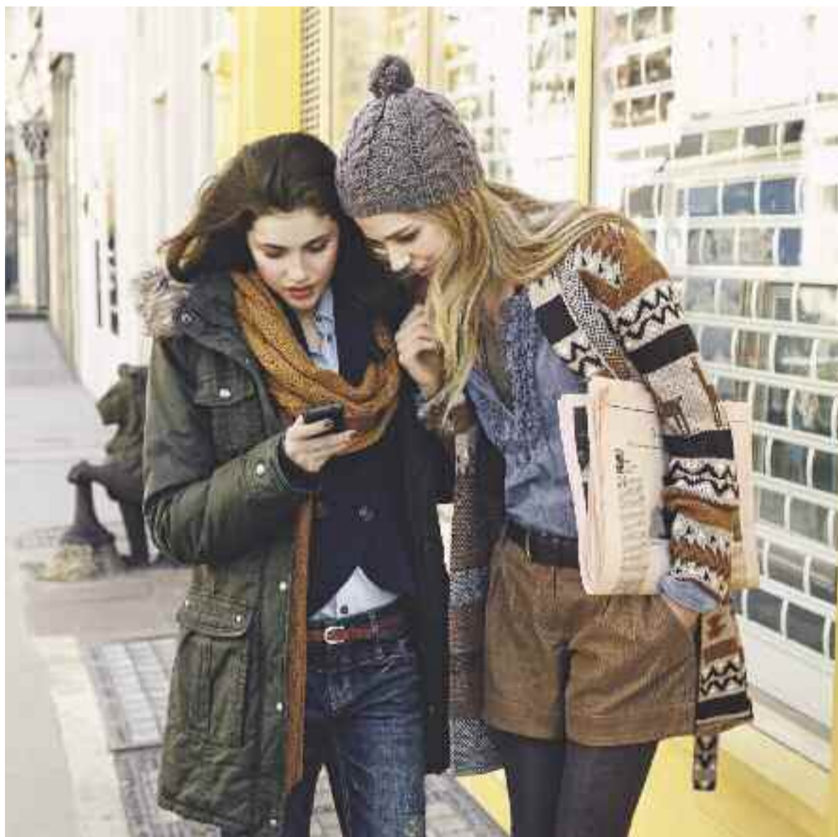
Country-Look für die Großstadtsafari – die kernigen Looks mit femininem Touch sind nicht nur für einen Ausflug aufs Land geeignet, sondern durchaus city-tauglich.

Wie schon erwähnt: In dieser Saison dürfen sich auch die Damen auf kernige Looks freuen. Die sind aber keinesfalls dafür gedacht, nur in der Natur ausgeführt zu werden, sondern eignen sich auch für den Stadtbummel mit der Freundin oder das Büro, denn die vom britischen Schick inspirierten Kollektionen sind durchaus feminin. Klassische Musterungen wie Karos, Tweeds bestimmen das Bild ebenso wie Cord, Pelz, Grobstrick und Lammfell, Leder und fantasievolle Norwegermuster. Ein weiterer Trend: Nostalgie. Hiermit ist allerdings nicht das Rokokokleid gemeint, sondern der Charme der 70er-Jahre. Freuen Sie sich auf die Neuinterpretation von Hemdblusenkleidern, Blazer mit breiten Revers, ausgestellte Hosen mit Schlag oder im Bootcut und weit schwingende Röcke. Sie lieben es schön weiblich, aber nicht zu sexy? Dann freuen Sie sich auf die neue Schlichtheit. Schmale Hosen, zauberhafte Schluppenblusen, Wollmäntel mit breiten Kragen, Marlenehosen und edle Strickoberteile bestimmen das Bild. Sanfte Farben in harmonischem Zusammenspiel schmeicheln dem Teint. Doch zu brav? Kein Problem, dann folgen Sie doch dem Trend neue Weiblichkeit mit weichen Silhouetten oder schmal geschnittenen Röcken und Kleidern in Schlangenoptik.