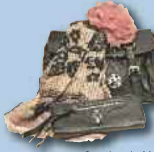
Gesehen bei I am

Dieses tolle Ensemble entdeckten wir bei I am – bleibt nur zu sagen: Must-Have!