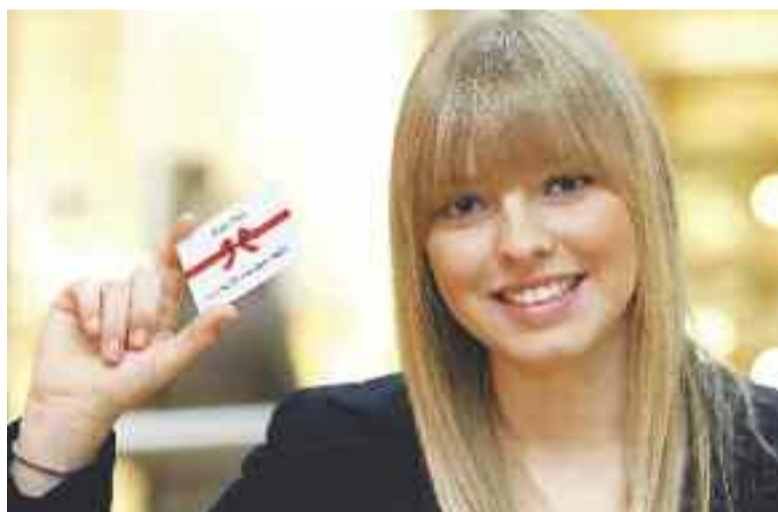
Erhältlich ist der Center-Gutschein an der Kundeninformation im Erdgeschoss des Hessen-Center.

Ein Center-Gutschein erfüllt kleine und große Wünsche