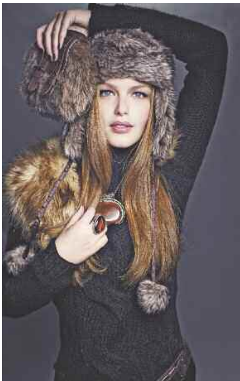
Fantastic Fur – Täuschend echte Kunstpelze legen sich als mondäne Stola um die Schultern, Trappermützen spielen mit Satin und Fell; eine kuschelige Umhängetasche macht das Trio komplett. Zur Spur moderner Raubkatzen gesellen sich auffällige Schmuckstücke.

Kein Outfit ist perfekt ohne die passenden Accessoires – das fängt bei der Kopfbedeckung an und endet bei den Füßen. Grobe Strickmützen und Pelzkappen erobern in dieser Saison die Köpfe von Damen und Herren. Besonders modemutige Damen setzen sozusagen noch eins drauf und greifen zum großen Schlapphut. Schals kommen in flauschig weichem Strick daher und dürfen auf jeden Fall üppig sein – auch das gilt für SIE und IHN. Klassische Damenschmücker wie Halsketten, Armreifen und Ohrringe gibt es für jeden Kleidungsstil, ganz gleich ob in verschwenderischer Fülle mit Perlen oder großen Kristallen oder in dezenter Zurückhaltung. Hervorzuheben sind nostalgische Medaillons, an langen Ketten baumelnd. Natürlich schmücken sie sich auch gern mit hübschen Zeitmessern im antiken Silber- oder Gold-Look. Besonders für die Damen ist ein Accessoire in dieser Saison unverzichtbar: ein schmaler Gürtel, den SIE auf dem Etuikleid, Blazer, aber auch zum grob gestrickten Cardigan trägt. Ach ja – und dann ist da noch etwas: Schuhe, Schuhe, Schuhe. Sie haben in dieser Saison besonders tolle Auftritte und präsentieren sich wie die Mode im rustikalen Countrystyle bis zu eleganten High Heels. Wir waren für Sie im Hessen-Center unterwegs und zeigen Ihnen auf dieser Seite einige Trends der neuen Saison – viel Spaß beim Entdecken.