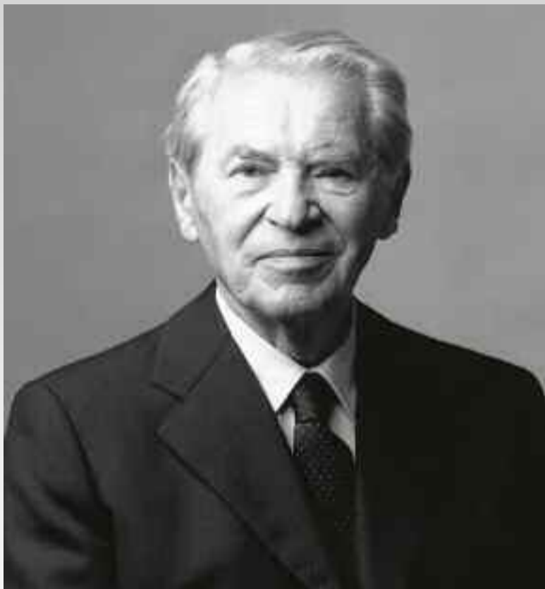
Werner Otto starb am 21. Dezember im Alter von 102 Jahren.

Er gehörte zu den markantesten und erfolgreichsten Persönlichkeiten der sozialen Marktwirtschaft: Der Unternehmer und Mäzen Prof. Dr. h.c. Werner Otto ist am 21. Dezember im Alter von 102 Jahren im Kreise seiner Familie in Berlin gestorben.