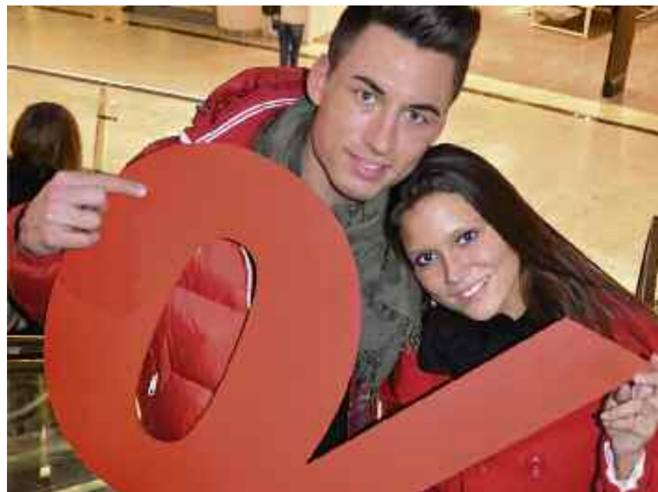
Bis zu 50 % wurde die aktuelle Herbst- und Winterkollektion im Hessen-Center reduziert.

In diesen Tagen wird ein modischer Bummel durchs Hessen-Center zu einem besonderen Vergnügen. Hier finden Sie traumhafte Herbst- und Wintermode zu fantastischen Preisen, und das gilt nicht nur für die Sonderflächen in der Mall. Bis zu 50 Prozent wurden viele Artikel reduziert und in etlichen Geschäften gibt es zusätzliche Rabatte auf die bereits reduzierten Artikel. Ganz gleich ob Sie noch auf der Suche nach einer wärmenden Winterjacke sind, sich ein paar schicke Stiefel, eine fetzige Jeans, ein hübsches Kleid oder ein kuscheliges Strickoberteil gönnen möchten – im Hessen-Center werden Sie ganz sicher fündig. Schnäppchen gibt es derzeit nicht nur in den Bekleidungsgeschäften. Auch Dekoratives und Haushaltswaren wurden reduziert – und in beiden Fällen gilt: Der Winter kommt bestimmt! Zeigen Sie ihm die kalte Schulter und freuen Sie sich auf heiße Preise.