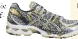
Gesehen bei Runners Point

Der Asics Gel-Nimbus setzt den Maßstab in der Neutralkategorie wieder ein Stück höher. Der Herren-Laufschuh überzeugt durch optimierte Passform und UV-Schutz, Solyte®-Zwischensohle mit vertikaler Flexkerbe zur Optimierung der Abrollbewegung, zusätzlicher Vorfuß- und Fersendämpfung sowie seine Mittelfußunterstützung für Stabilität und Bewegungskontrolle.