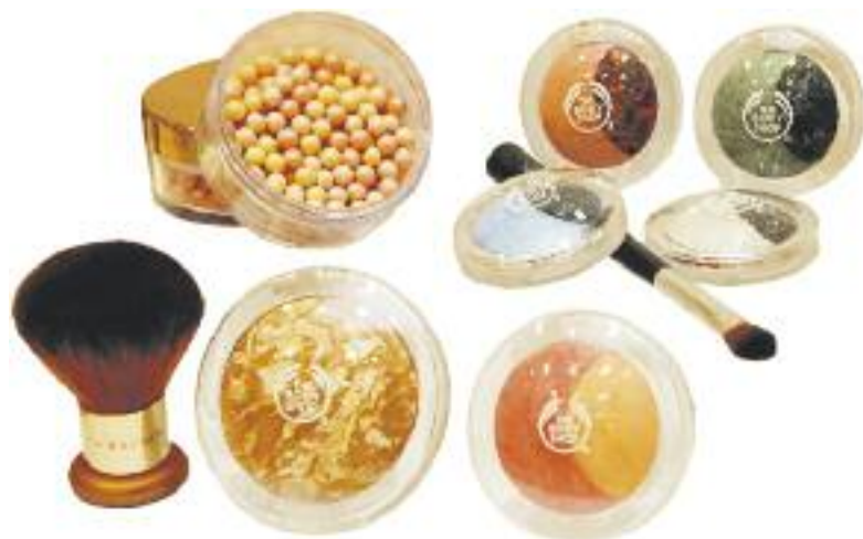
Schimmernde Schöne aus dem Ofen: „Baked-to-Last“ von The Body Shop.

len Teint mit schimmernden Farbreflexen sorgt der marmorierte Bronzepuder. Rouge betont die Wangen und gibt strahlende Frische. Sie kommen zwar nicht aus dem Ofen, sorgen aber ebenfalls für einen sommerlichen Teint, die Puderperlen in Apricot und Bronze. Gesehen haben wir die schimmernden Stars bei: The Body Shop.