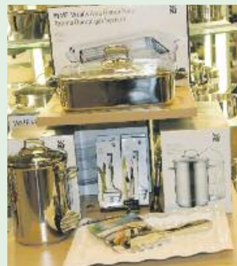
Praktische Zubereitungshelfer, elegantes Kochgeschirr und stilvolle Servierprodukte für Spargel finden Sie in der Galeria Kaufhof.

Schon beim Anblick dieser tollen Küchenhelfer und Servierhilfen wächst die Vorfreude auf das nächste Spargelessen. Ob Spargelschäler, -zange, Spargeltopf aus poliertem Edelstahl oder Dampfgerät – hier wird schon die Zubereitung zum Genuss, bevor Sie das köstliche Ergebnis auf einer Spargelplatte anrichten und servieren. Wahrhaft glanzvolle Zeiten – wie es sich gehört für ein königliches Gemüse.