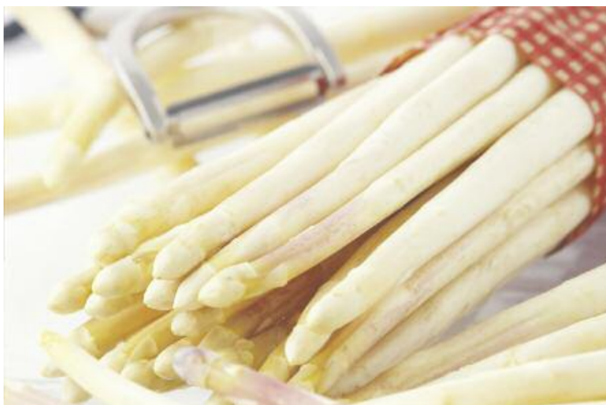
Stange für Stange purer Genuss, Spargel gehört zu den beliebtesten Saisongemüsen und lässt sich in unzähligen Varianten genießen. Entdecken Sie die Vielfalt der Delikatesse vom 12. bis 21. Mai während der großen Spargelwoche im Hessen-Center.

Während wir im letzten Jahr lange auf den Genuss des ersten heimischen Spargels warten mussten, hat Petrus es in diesem Jahr gut mit uns gemeint. Die milden Tage und die vom Himmel lachende Sonne im März führten dazu, dass die Verfrühungssysteme (darunter versteht man die Folienabdeckungen) ihre Wirkung voll entfaltet. So konnte an manchen Standorten bereits Ende März der erste Spargel gestochen werden. Und nun sind wir praktisch schon mittendrin in der Saison des königlichen Gemüses, das sich immer größerer Beliebtheit erfreut. Kein Wunder, denn ganz gleich ob pur oder als Beilage, Spargel ist stets ein Hochgenuss und wird noch immer von Hand geerntet. Ob in Nord-, Ost-, West- oder Süddeutschland – überall liebt man Spargel und baut ihn dort an, wo lockere, sandige Böden es erlauben. Traditionell isst man das Gemüse zu jungen Petersilienkartoffelchen mit zerlassener Butter und Buttersemmelbröseln, gern aber auch mit gekochtem Schinken und Sauce holländaise. Allerdings gibt es auch zahlreiche moderne Variationen, die es durchaus wert sind, probiert zu werden. Da die Spargelsaison diese Jahr so früh begonnen hat, bleibt genügend Zeit, um auf eine ausgiebige kulinarische Spargelreise