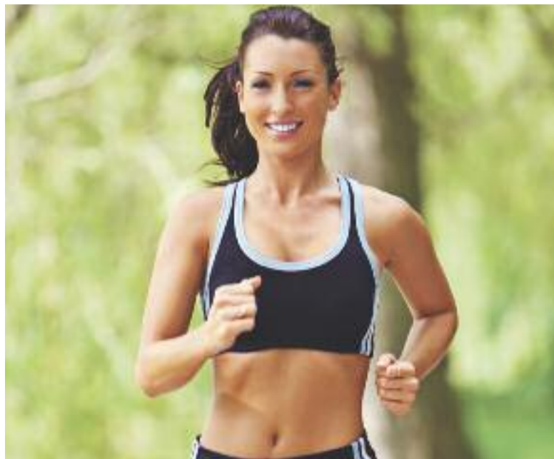
Laufen Sie mit beim 23. Frankfurter Volkslauf. Mehr unter: www.sgenkheim.de Am besten Sie melden sich gleich an (Startgebühren ab 1,50 Euro bis 5 Euro).

Keine Ausreden mehr, jetzt geht es los. Endlich erlauben die Temperaturen wieder sportliche Aktivitäten an der frischen Luft. Zeit, in die Laufschuhe zu schlüpfen und loszuzufitzen. Unsere Region bietet Läufern eine fantastische Auswahl an Strecken unterschiedlichster Facetten und Schwierigkeitsgrade – da ist für jeden etwas dabei.