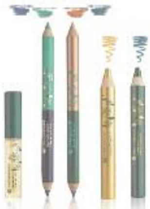
Trend-Make-up für einen „fabelhaften“ Augenaufschlag.

Yves Rocher präsentiert Trend-Make-up und Pflege aus dem Fabel-Reich der Nymphen