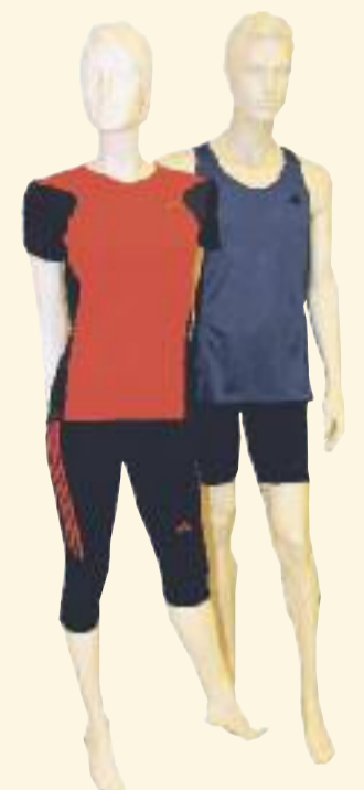
Gesehen bei Galeria Kaufhof

Jede sportliche Aktivität macht einfach noch mehr Spaß, wenn man sich richtig anzieht – und das ist nicht nur aus modischer Sicht zu sehen. Denn funktionelle Sportbekleidung transportiert Feuchtigkeit nach außen, ist atmungsaktiv und sorgt dadurch für mehr Wohlbefinden.