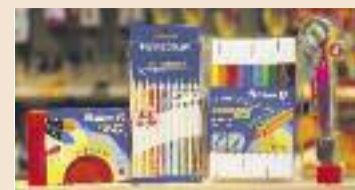
Stifte, Füller und Co. sind eine gute Befüllidee. Gesehen bei: McPaper.

Erinnern Sie sich noch an den Tag, als Sie zum ersten Mal zur Schule gehen durften? Daran, wie aufgeregt Sie waren. Wie würde Ihr Lehrer heißen, wer kam mit in Ihre Klasse, und durften Sie neben dem besten Freund oder der besten Freundin sitzen? Und dann war da natürlich die für viele Kinder an diesem Tag wohl wichtigste Frage: Was würde in der Schultüte versteckt sein? Damit Sie auch genau die Schultüte bekommen, die die Kleinen gern hätten, sollten Sie sie schon früh besorgen,