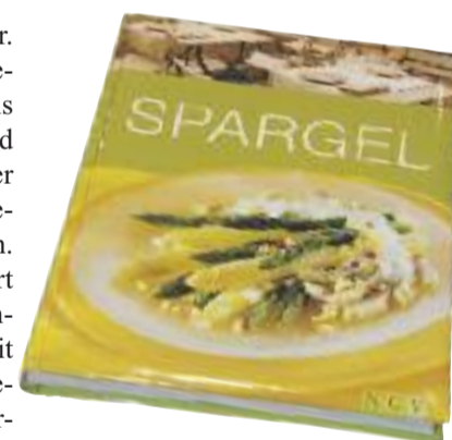
Beide Titel gesehen bei Hugendubel

► Zarte Stangen für Genießer. Über 100 neue, sorgfältig ausgewählte Rezepte, vom Klassiker bis zum Trendgericht: Suppen und kleine Speisen, Spargel als idealer Begleiter von Fleisch, Wild, Geflügel, Fisch und Meeresfrüchten. Mit einem fachkundigen Vorwort zur Geschichte, zu Sorten, Handelsklassen und Zubereitung. Mit brillanten Foodfotos zu jedem Rezept und ausführlicher Schritt-für-Schritt-Anleitung. Verlag: Naumann & Göbel