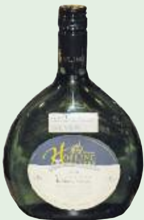
Tipps vom Weindepot Vinum

Sie lieben Spargel ganz schlicht nur mit zerlassener Butter und Kartoffeln? Dann ist ein Silvaner aus Franken, wie zum Beispiel der vom Weingut Höfling, die perfekte Ergänzung. Seine intensiven Fruchtaromen von Pfirsich, Citrus und Melone harmonisieren besonders gut mit purem Spargel.