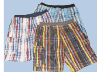
Gesehen bei Intersport Leister

Sie sind ein Saisonmuss für IHN: die Badeshorts. In diesem Jahr sollte Mann unbedingt ein forales Modell aber auch ein gestreiftes oder kariertes mit an den Strand nehmen.