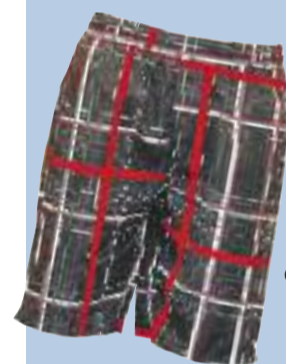
Gesehen bei C&A

Sie sind ein Saisonmuss für IHN: die Badeshorts. In diesem Jahr sollte Mann unbedingt ein forales Modell aber auch ein gestreiftes oder kariertes mit an den Strand nehmen.