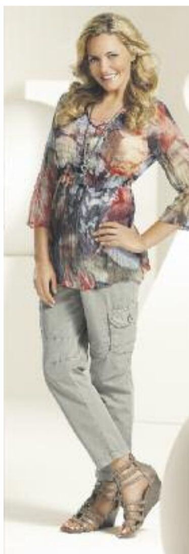
▲ Sanfte Naturtöne und florale Druckimpressionen vermitteln einen Hauch Safari-Schick.