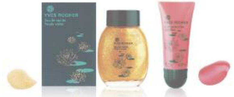
Schimmernde Schönheit – Reflexe sind das Saisonhighlight.

Ein Sonnenstrahl durchbricht Blätter und Äste und reflektiert auf dem Wasser in den verschiedensten Farben. Inspiriert von den spritzigen Launen des Sommers und der Fabel-Wesen, kreierte Yves Rocher seinen Sommerlook