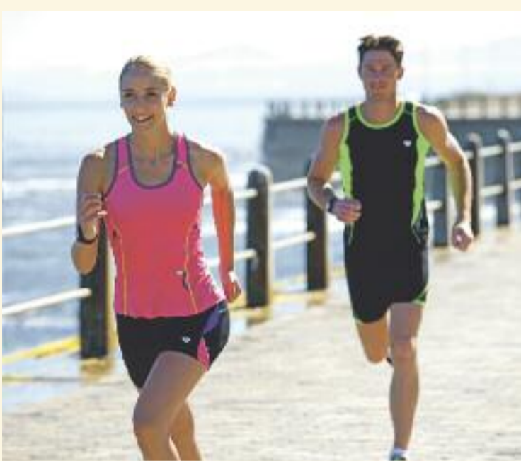
Für läuferisches Vergnügen – die neue Kollektion von Runners Point.