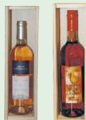
Gesehen bei Weindepot Vinum

Dürfen es Schweinelendchen zum Spargel sein oder eine Spargelquiche mit mediterranen Gewürzen? Dann sollten Sie unbedingt mal einen Côte de Provence Chateau Les Mesclanes oder den Sommer Rosé von Bischoffinger dazu probieren – Sie werden begeistert sein.