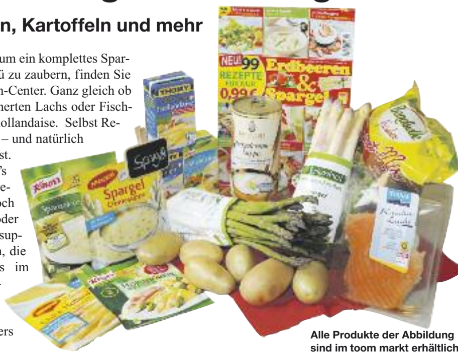
Alle Produkte der Abbildung sind im toom markt erhältlich.

Alles, was Sie brauchen, um ein komplettes Spargelgericht oder gar -menü zu zaubern, finden Sie im toom markt im Hessen-Center. Ganz gleich ob junge Kartoffeln, geräucherten Lachs oder Fischfilets, Salat oder Sauce holländaise. Selbst Rezeptideen warten auf Sie – und natürlich auch das Gemüse selbst. Für Suppen-Kasper gibt's auch leckere Spargelcremesuppe, die Sie nur noch zu erhitzen brauchen, oder aus der Tüte. Bei Tütensuppen empfehlen wir Ihnen, die Schalen des Gemüses im Spargelwasser auszukochen und dies statt purem Wassers zu verwenden. So wird sie besonders aromatisch.