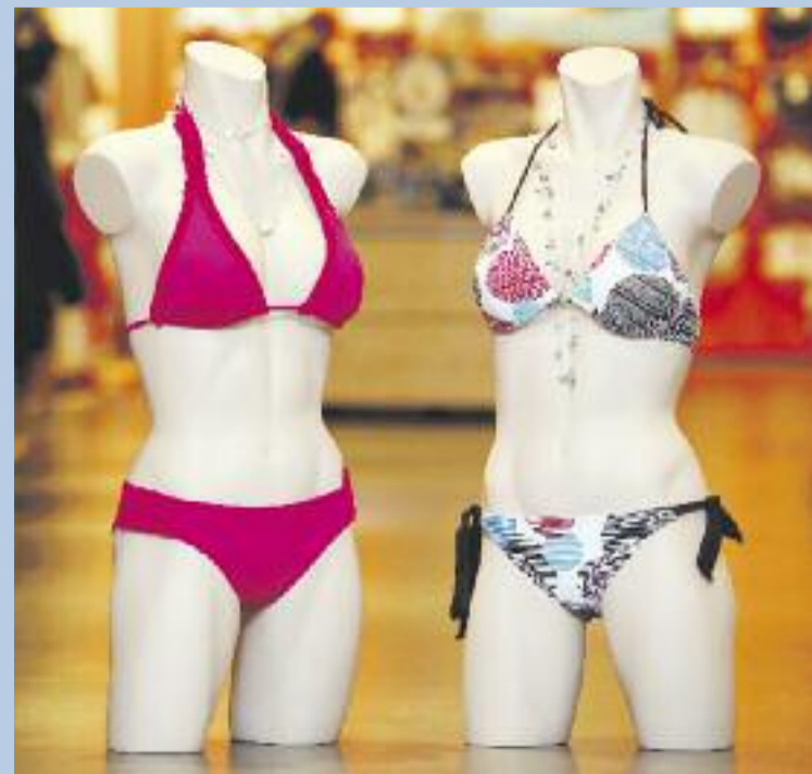
Gesehen bei C & A

Ob pink berücht oder bunt gebunden, egal für welches dieser beiden Modelle Sie sich entscheiden, eines ist gewiss: Sie werden sich vor anerkennenden, etwas länger andauernden und manchmal vielleicht auch neidischen Blicken nicht retten können. Aber wie auch immer die Blicke gedacht sind, diese beiden sind sie in jedem Fall wert und verhehlen ihrer Trägerin ganz sicher zu einem perfekten Strandaufritt – den so Man(n)cher nicht so schnell vergessen wird.