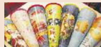
Eine große Auswahl an Schultüten finden Sie bei Faix, Galeria Kaufhof und McPaper.

dann können Sie ganz entspannt mit dem Ausschauen der Kleinigkeiten beginnen, die Sie hineintun möchten. Die Schultüte, die eigentlich dazu gedacht war, den Erstklässlern den Einstieg in den neuen Lebensabschnitt mit Süßigkeiten schmackhaft zu machen, sollte aber nicht nur mit Leckereien gefüllt sein. Packen Sie durchaus auch kleine Lernspiele, Stifte und vielleicht sogar den Füllfederhalter dazu. Beliebt sind auch kleine Figuren, die die Kids vielleicht später sogar als Glücksbringer benutzen.