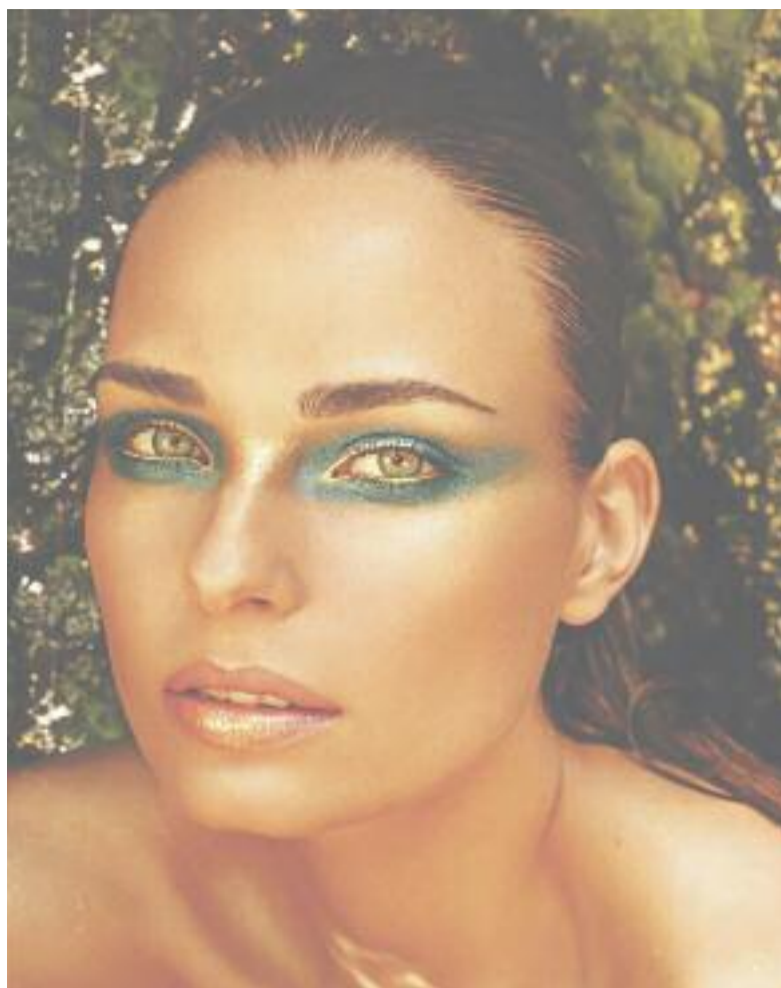
Schimmernde Schönheit – Reflexe sind das Saisonhighlight.

Die Mode zeigt sich in dieser Saison in vielen Facetten – von casual über romantisch, von feminin bis ladylike. Klar, dass da die dekorative Kosmetik einhergeht und Gegensätze zeigt. Denn für jeden Stil, ob minimalistisch oder extrem betont, ob sportlich, natürlich oder feminin, findet sich das passende Make-up. So zeigen sich zarte Farbhightlights genauso wie der großer Glamour. Verführen Pastellnuancen die Romantikerin, verschaffen glitzernde Pigmente geheimnisvollen Schimmer, und rote Lippen sorgen am Abend für den großen Auftritt der Femme fatale. Letztere ist übrigens auch tagsüber gefragt, deshalb gibt es Lippenstifte und Glosse in dieser Saison in einer Vielzahl von Farbtönen, die tagsüber in nicht ganz so intensiven Varianten zum Einsatz kommen und am Abend leuchtend und leidenschaftlich durchaus für einen theatralischen Auftritt sorgen dürfen. Beim Augen-Make-up zeigt sich eine schier unendliche Farbvielfalt, in der sich wirklich jede Frau wiederfinden kann. Auffällig – grund-