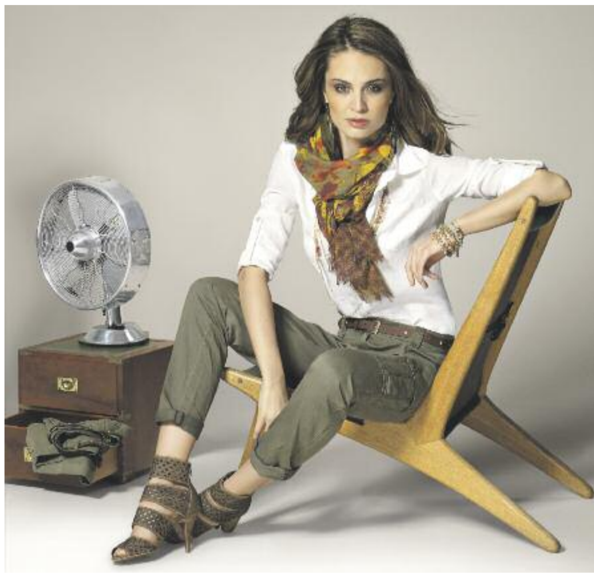
Casuallike und bürotauglich – der Safari-Style. Er bleibt auch im Sommer Top-Thema.

Lässig, romantisch, leicht und luftig, glänzend und farbenfroh – das kommt im Sommer