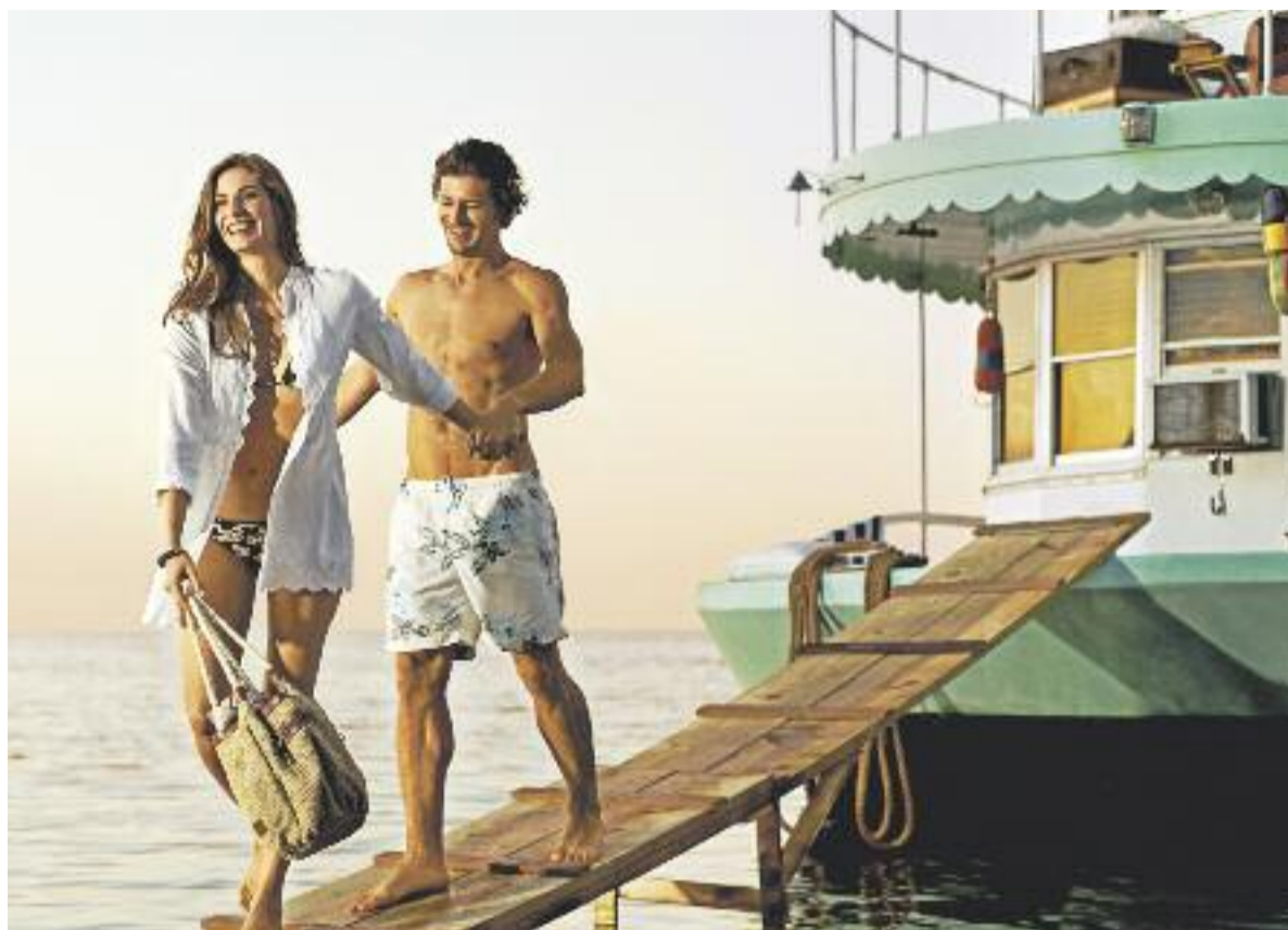
Die neue Bademode setzt auf Abwechslungsreichtum. Während für Sie wichtige Accessoires wie eine leichte Leinentunika dazugehören, überzeugt Er solo und setzt auf Shorts mit auffälligen Dessinierungen.

Ist es nicht herrlich, draußen grünt und blüht es, und die ersten sonnigen Tage, bei denen wir im Garten bereits ein wenig ins Schwitzen gerieten, lassen uns schon jetzt von einem heißen Sommer und der damit verbundenen Abkühlung am heimischen Badesee, an Nord- und Ostsee oder in südlicheren Gefilden träumen. Zum Glück dauert es auch gar nicht mehr so lange, bis der Sommer das Zepter vom Frühling übernimmt – davon künden die bereits jetzt im Hessen-Center eingetroffenen Beachoutfits, die sich so abwechslungsreich wie nie zuvor präsentieren. Die Dessinierungen zeigen sich animallike, rücken Blüten in den Vordergrund, sorgen mit frechen Karos und Streifen für fröhliches Beachfeeling oder regen in Batikmustern die Fantasie an. Wer's uni mag, kommt ebenfalls voll und ganz auf seine Kosten. Für alle, die im Sommer gern dem Yachtfieber erliegen oder mit ihrem Segelboot Bucht für Bucht die schönsten Seiten ihres Urlaubslandes erkunden möchten, gibt's ebenfalls gute Nachrichten: Der Marine-Style ist auch in der Bademode ganz groß im Kommen. Noch ein eindeutiger Trend ist zu erkennen, der vor allem für die Damenbademode gilt: Weniger ist mehr! Die Modelle sind noch knapper und figurbetonter als im letzten Jahr – gewähren gern tiefe Einblicke und zeigen hohe Beinausschnitte, besonders